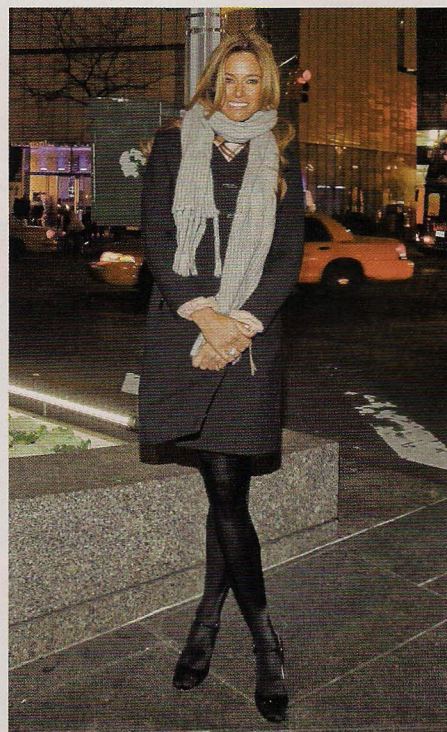
Markenbotschafterin: Modell und Autorin Kelly Killoren Bensimon.